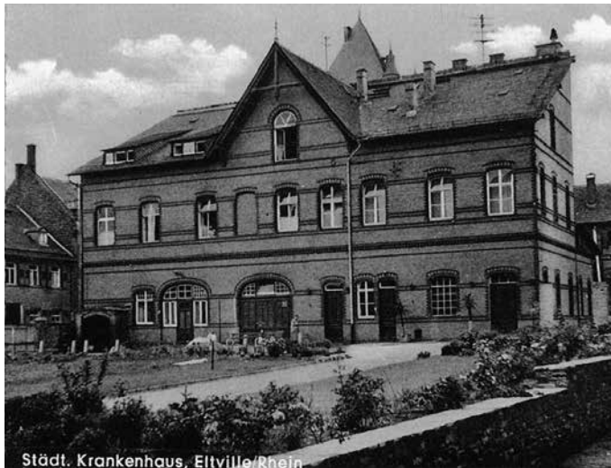
Städt. Krankenhaus, Eltville/Rhein