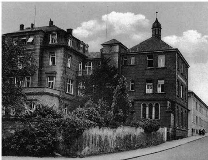
Krankenhausgebäude Eltville, rechts Krankenhauskapelle, nach oben der damals neue Erweiterungsbau

In der Stubb, in der isch dann gewese bin, warn schun zwa Weibsbilder, die hadde in de Bedder gelehe. Die o war des GOLDCHE un die anner hot sich LIEBSCHE genennt. Isch sahn eisch, die hadde misch dann gläsch verhätschelt un vesorscht. Nachts konnt isch nit schloofe, es war alles nei, un die zwa Weiber hadde dauernd gebabbelt;