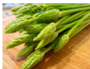
Pyrenäenmilchstern (Bildquelle: Internet)

Bei dem Spargel den die Wurtzler gesammelt haben handelt es sich um die Wildform „ Asparagus acutifolius “. Sie ist heute noch im ganzen Mittelmeerraum zu finden. Die Pflanze treibt knapp fingerdicke Sprossen, von denen man aber höchstens die obersten zehn Zentimeter essen kann, der Rest ist holzig. Der herzhafte Geschmack erinnert an Kapern. In Italien wird der wilde Spargel im Frühling mit Spaghetti serviert. Auf den Märkten in unserer Umgebung habe ich diese Spargelart noch nicht gefunden. Allerdings wird auf unseren Märkten „Wildspargel“ angeboten, der keiner ist, nämlich der Pyrenäenmilchstern.