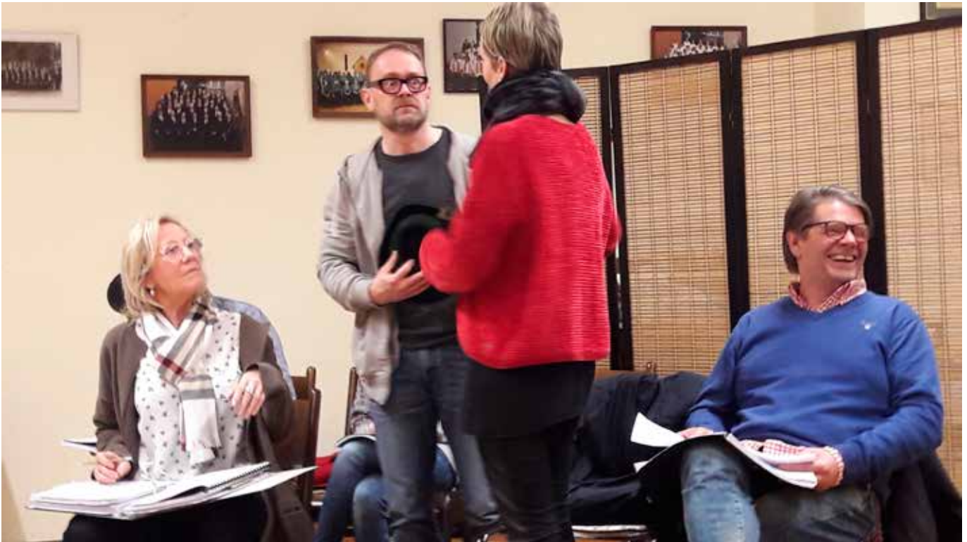
Die Proben sind einerseits harte Arbeit, aber machen den Beteiligten, wie man sieht, auch durchaus Spaß