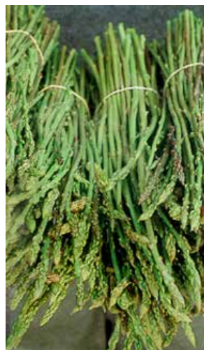
(Markthalle von Pollica/Cilento). (In de Ingelnummer Rheißwisse derd se uffgefresse seiß, die Sparschelwurtz.)

Antorff (Antwerpen). Eine Reise vom Rhein nach Antwerpen war im 16. Jahrhundert nicht unüblich. Dürers Reisebeschreibung nach Antwerpen von 1520 ist noch erhalten. Und die „spargen wurtzel“ die die Wurtzler zu transportieren hatten waren nicht so empfindlich wie die heutigen weißen Luxusstangen. Auf einigen Stillleben des Antwerpener Malers Frans Snyders (1579-1657) sehen wir als Wohlstandssymbole auch Spargelbündel. Vielleicht aus Ingelheim?