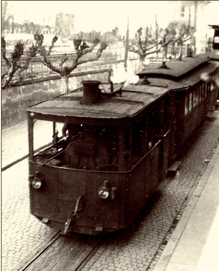
Der feurige Elias bei der Abfahrt in der Wilhelmstraße in Eltville

Uffgeschribbe von emme Herr Baumgart aus Schlagebad, jetzt noch emol uff Platt verzehlt von Helga Simon