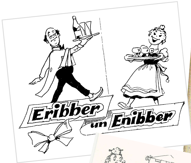
Titelskizze für das gleichnamige Theaterstück, rechts Illustration zum ersten Buch „En Dutt voll Micke“.