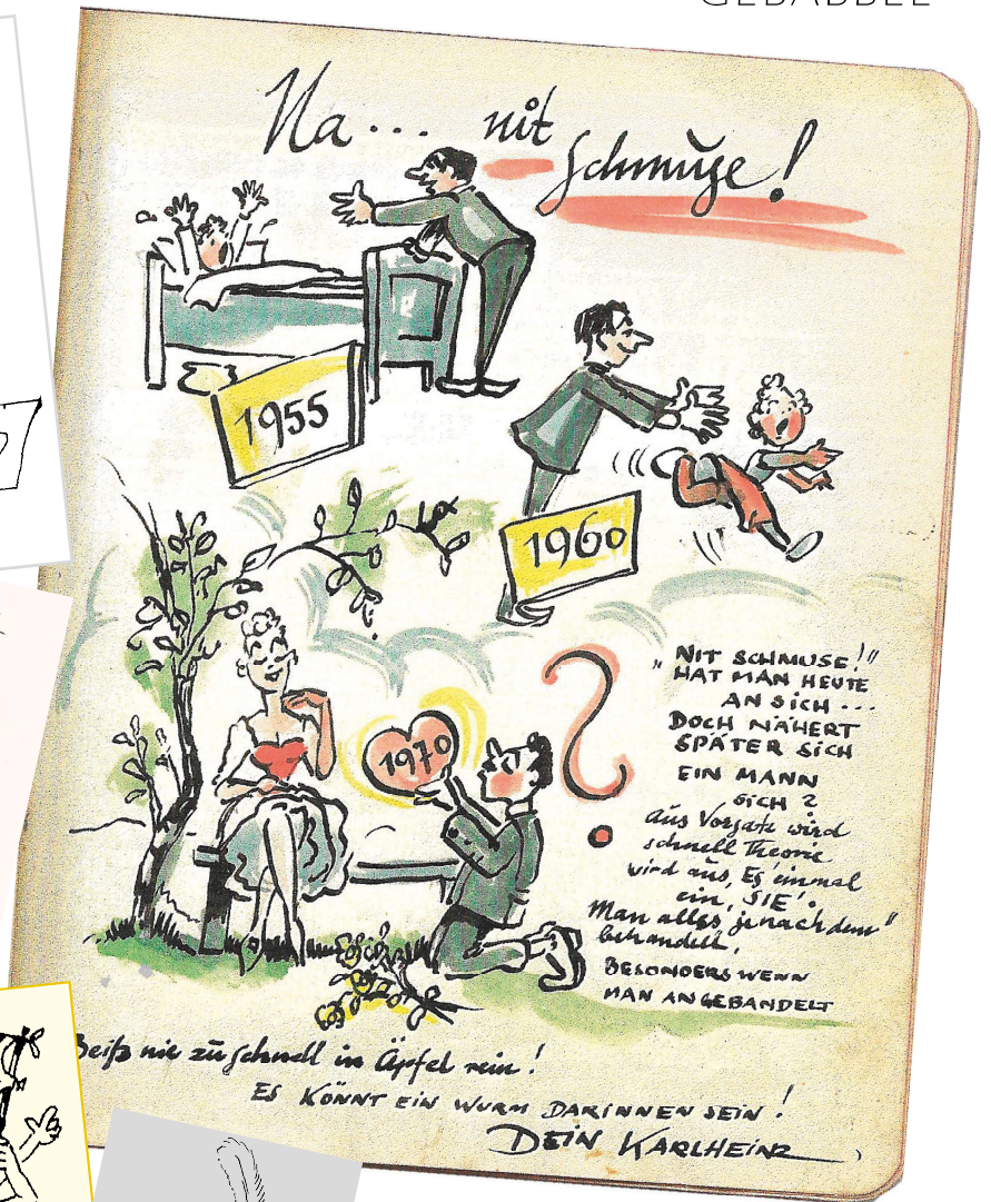
Seite aus dem Poesiealbum von Ulrike Neradt, damals noch Ulrike Seyfardt