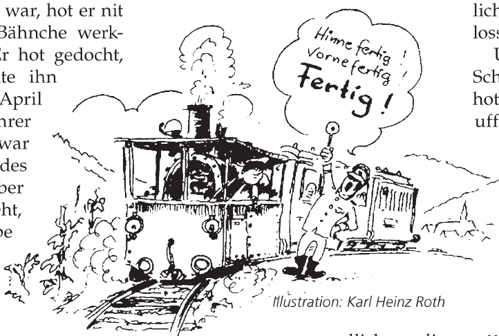
Illustration: Karl Heinz Roth

Die Kolleesche, die sich korz vor Feierabend aach schon en Schobbe genehmischt hatte, hadde den uffgereeschde Kerl mit „Hallo“ empfangen un hadde sich die Geschichte von der Entgleisung in alle Einzelheide verzähle losse. Sie hadde sich dodebei halb krank gelacht un immer widder „April, April“ gerufe. Der Kerl hot abber koa Ruh gebbe un immer widder devon oagefange, un als aach die Schlangebader nochemol oagerufe hadde,