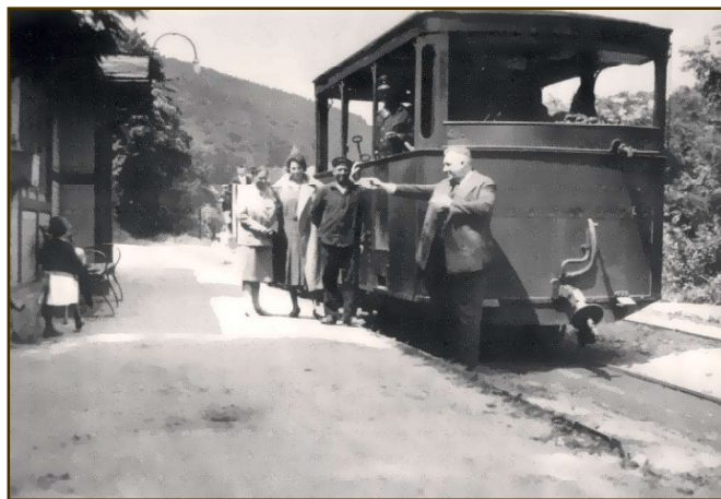
Der feurige Elias an der Endstation, dem Bahnhof in Schlangebad

rollt, wo es durch irchend en Missgeschick zu eme Unfall komme is. Die Loggmodiv is aus de Gleise gehippt un alle Vesuche die widder in die richdisch Laach zu bringe, sin gescheitert. De Zugführer hot den Unfall pflichtgemäß telefonisch in Ellfeld gemeldet – un hot en Ersatzloggemotiv oagefordert, die uff em schnellste Weech nooch Schlangebad komme sollt, weil do nämlich etliche Reisende gewaad hadde, die ihr Oaschlusszüch in Ellfeld nit versäume wollde.